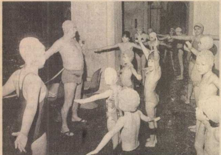
Egy kis bemelegítés...